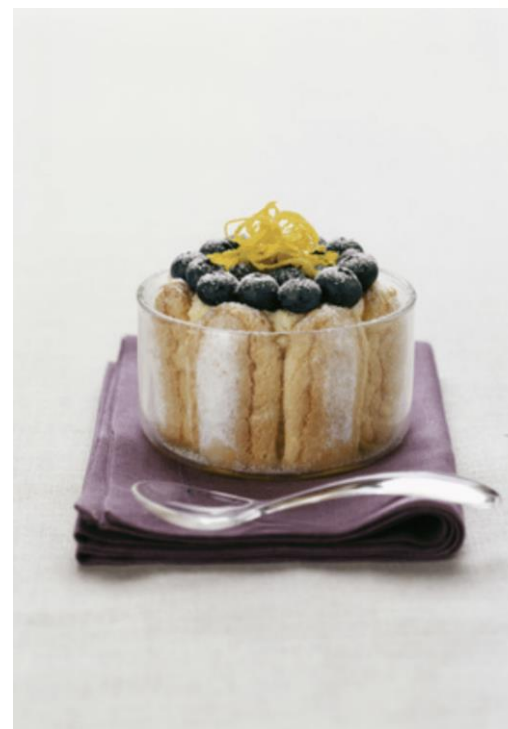
Verrine de charlotte aux fruits

La Semaine du Goût® a choisi Restolib pour ses animations pédagogiques