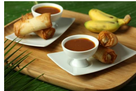
Nems de pomme au thé et caramel coco