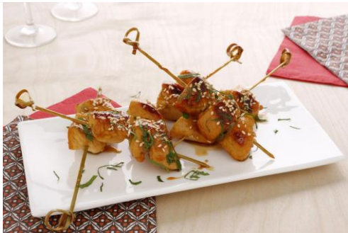
Brochette poulet, sauce yaourt au citron et coriandre